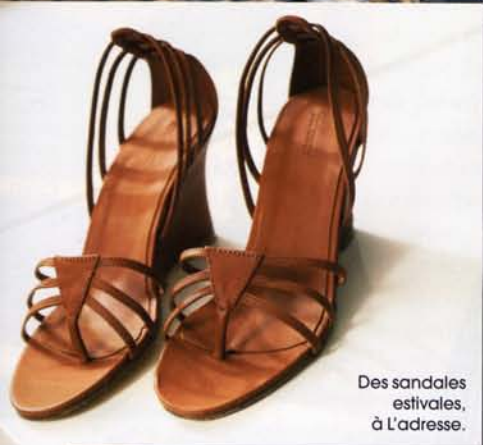
Des sandales estivales, à L'adresse.