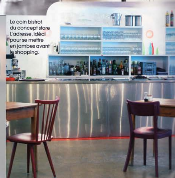
Le coin bistrot du concept store L'adresse, idéal pour se mettre en jambes avant le shopping.