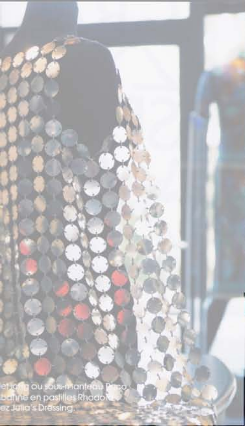
Le long ou sous-manteau Disco barine en pastilles Rhodol. chez Julia's Dressing.