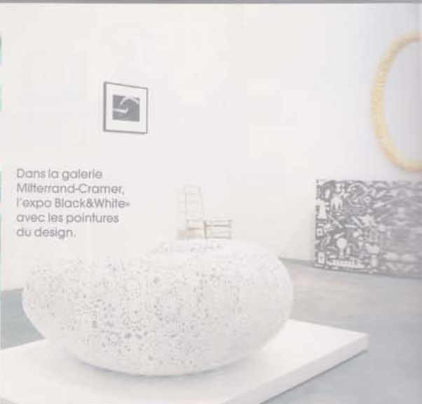
Dans la galerie Mitterrand-Cramer, l'expo Black&White avec les peintures du design.