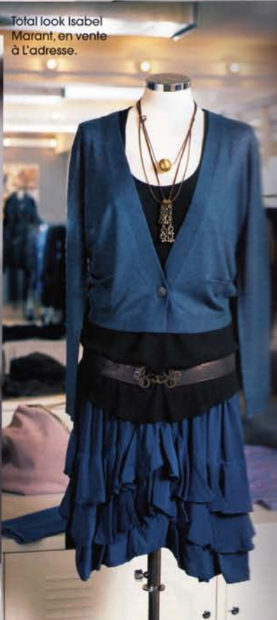
Total look Isabel Marant, en vente à L'adresse.