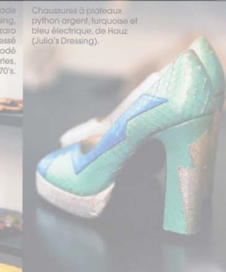
Chaussures à plateaux python argent, turquoise et bleu électrique, de Hauz (Julia's Dressing).