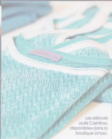
Les délicats pulls Cashflow, disponibles dans la boutique Limao.